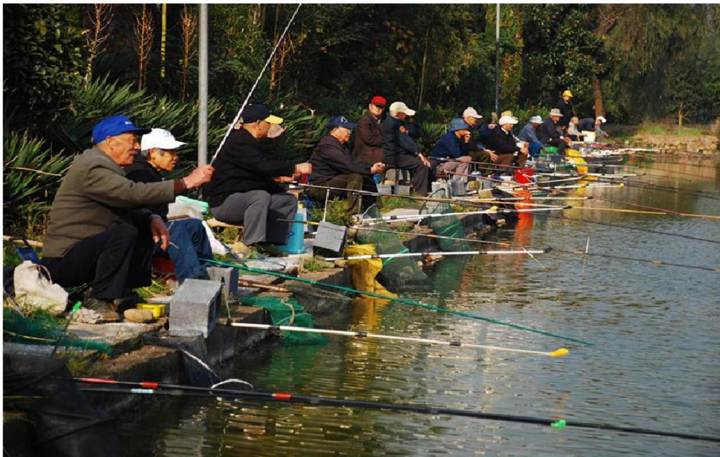
老人蹲在池塘边垂钓。